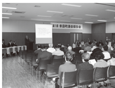
▲第1回報告会の様子