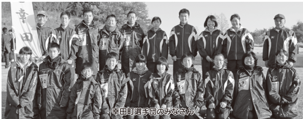
幸田町選手団のみなさん