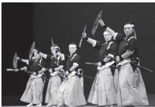
▲ステージ発表の様子

幸田文化協会が主催する秋の文化祭がハッピーネス・ヒル・幸田で2日間にわたって開催されました。町民会館のさくらホールとつばきホールのステージで加盟団体による芸能発表会が行われたほか、あじさいホールや図書館ギャラリーなどでは作品の展示が行われ、約2,800人が会場を訪れて芸術の秋を楽しみました。