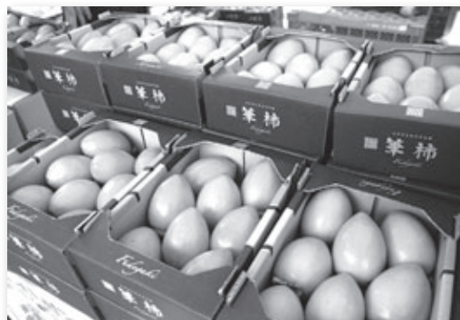
▲品評会に出品された筆柿