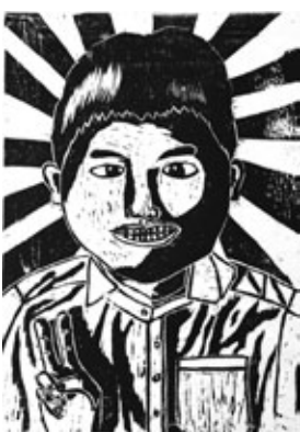
『はい、ピース！』 【木版画】