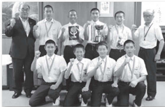
▲岡崎幸田選抜チームに幸田から選ばれた8人

幸田町と岡崎市の中学生で編成される「岡崎幸田選抜チーム」が第11回U15全国KWB野球秋季大会の愛知大会で優勝して千葉県成田市で開催される全国大会に出場することが決定し、町内の3中学校から選手として選ばれている8人が報告に訪れました。