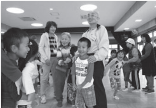
▲じゃんけん列車の様子

高齢者の健康づくりを目的として60歳以上の人を対象に小学校区単位で開催しているげんきかい。中央学区で活動しているげんきかいのメンバーが菱池保育園を訪問して園児たちと交流会を行いました。まずは一緒にじゃんけん列車をやって打ち解けた後、げんきかいメンバーが準備した輪なげなどのゲームを一緒に楽しみました。