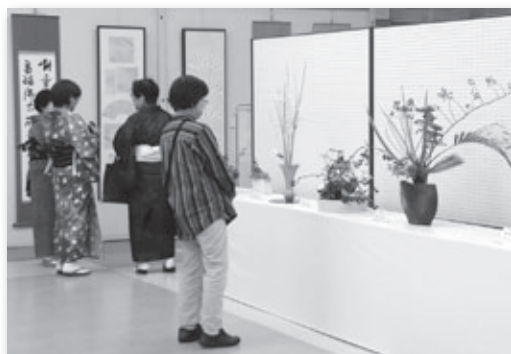
▲あじさいホールでの作品展示