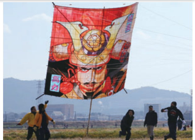
昨年度コンテスト優秀作品

問合せ こうた凧揚げまつり実行委員会事務局（幸田町教育委員会生涯学習課内、内線195）