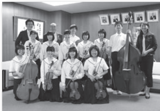
▲南部中学校弦楽部代表の皆さん

CBC子ども音楽コンクール中部日本決勝大会進出を決めた南部中学校弦楽部の代表11人が役場庁舎を訪問し、中部日本決勝大会進出を決めた受賞曲を披露しました。9月18日に開催された地区大会で合奏第1部門(35名以下の弦楽合奏)に出場。「弦楽セレナーデハ長調作品48」から第1楽章を演奏して優秀賞を受賞し、審査員全員の推薦によって、中部日本決勝大会への出場が決定しました。決勝大会では、優秀賞(第2位)を受賞しました。