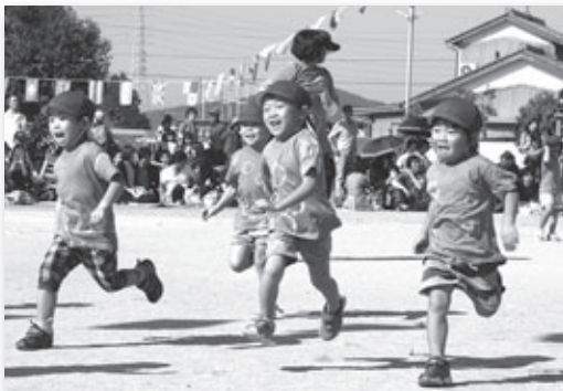
▲ゴール目指して全速力！

町内8保育園の運動会が10月1日、15日の2日にわたり開催されました。取材に訪れたわした保育園では秋晴れの空の下、この日までに取り組んできたことを自分の家族に見てもらおうと力いっぱい頑張る園児たちのたくましい姿が見られました。