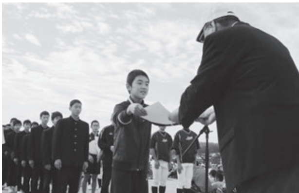
▲町民大運動会で行われた表彰の様子