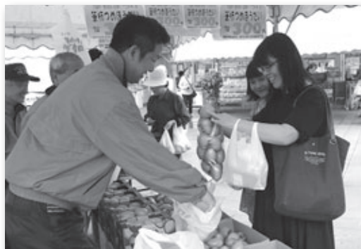
▲大人気の筆柿詰め放題コーナー

道の駅筆柿の里・幸田で恒例の筆柿まつりが開催され、来場者には樹齢推定300年の木に実った長寿の筆柿がプレゼントされました。恒例の筆柿詰め放題コーナーでは袋からはみ出た筆柿に思わず笑顔が。また筆柿品評会に出品された色つやともに綺麗にそろった筆柿の販売も行われました。