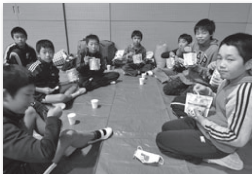
▲夕食では非常食を試食