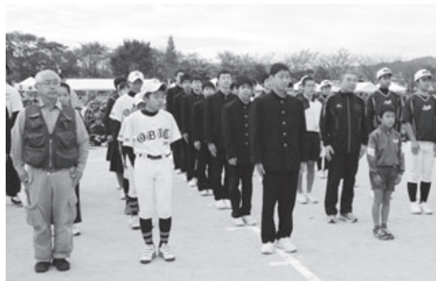
▲体育表彰受賞者の皆さん