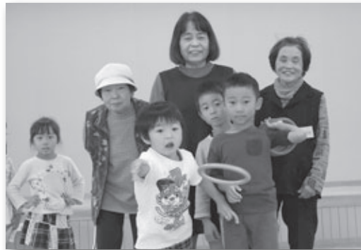
▲園児と一緒に輪なげを楽しみました