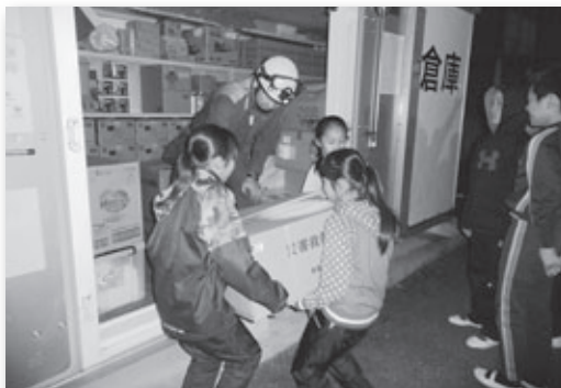
▲防災倉庫で機材を運ぶ児童

ふるさと学習の時間で防災について学んでいる中央小学校6年生が避難所宿泊体験を行いました。夕食に非常食を食べ、体育館にブルーシートを敷き寝袋や毛布に包まって宿泊しました。また地震について自分たちで事前に調べたことをお互いに発表したり、防災安全課職員や消防署職員から地震や防災備蓄倉庫についての話を聞き防災について学びました。