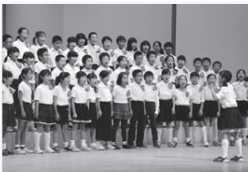
▲中央小学校4年生の合唱

第11回小中学校音楽会が町民会館さくらホールで開催されました。町内6小学校の児童による合唱や南部中学校弦楽部、北部中・幸田中学校吹奏楽部の演奏が披露されました。ステージに上がった児童・生徒たちは、堂々とした姿でこれまで練習してきた成果を発揮し、集まったお客さんたちから大きな拍手を送られていました。