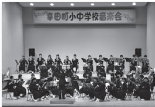
▲北部中学校吹奏楽部の演奏