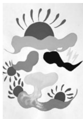
『私の気持ち、未来予想図』 【水彩画】

先生から ピースをする友だちの明るい表情を版画にしました。彫刻刀で彫る向きや背景を工夫し、生き生きとした作品を作ることができました。