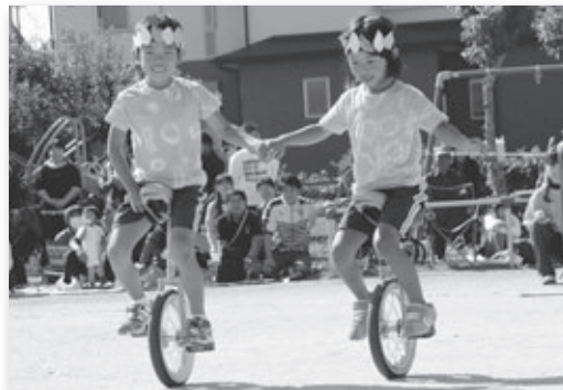
▲一輪車を披露する園児