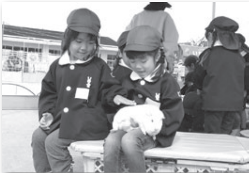
▲モルモットとのふれあいコーナー

いちご動物園が坂崎保育園を訪れ、園児たちが動物たちとのふれあいを楽しみました。定番となっている大人気のモルモットとのふれあいコーナー、ヤギへのエサやり体験に加えて、年長児を対象に乗馬体験も行われ、馬の背にまたがった園児たちは得意気な笑顔を見せていました。