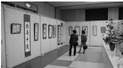
▲昨年の幸田文化協会秋の文化祭の様子

とき 10月29日(土) 午前9時～午後5時 10月30日(日) 午前9時～午後4時 ところ 幸田町民会館・図書館ギャラリー 主催 幸田文化協会 後援 幸田町・幸田町教育委員会・中日新聞社 問合せ 幸田文化協会 ☎63-5688