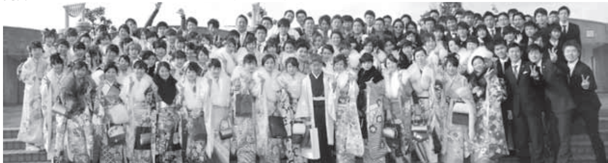
▲昨年度、第68回成人式より