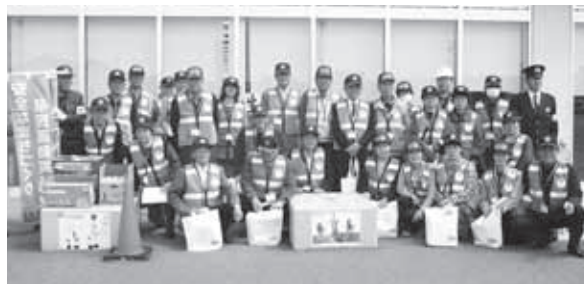
安全なまちづくり推進指導員の皆さん