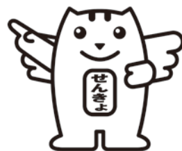
明るい選挙の イメージキャラクター 「めいすいくん」