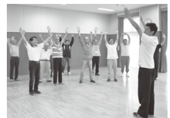
▲男のためのからだメンテナンス教室

ふだんから元気からだを動かすことで、 糖尿病、心臓病、脳卒中、がん、うつ、認 知症などになるリスクを下げることができます。 運動習慣のある人もふだん体を動か すことの少ないあなたも、健康寿命をのば すために、今より10分多くからだを動か すことから始めませんか。あなたも+10(プ ラス・テン)で、健康を手に入れましょう。