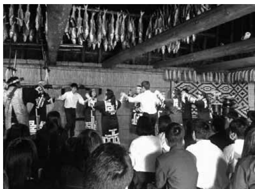
▲アイヌ民族博物館での舞踊公演

幸田高校では毎年五月に雄大な自然と特有の文化と歴史をもつ北海道に修学旅行に行っています。今年度は二班に分かれ、前半組は五月二十六日から、後半組は二十七日から二泊三日で実施しました。