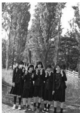
▲北海道大学ポプラ並木

初日は、千歳空港から白老のアイヌ民族博物館へ行きました。司会の方がたいへんおもしろい方で、アイヌの言語や生活について楽しみながら学ぶことができ、最後には伝統舞踊にも参加させていただきました。その後、登別地獄谷で班別研修を行い、硫黄の香りが漂う中、豊かな自然とふれあう良い機会となりました。