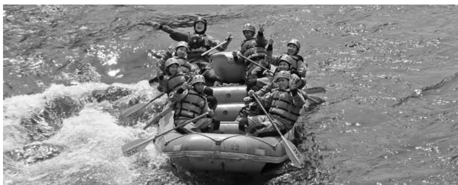
▲大自然を満喫するラフティング

初日は、千歳空港から白老のアイヌ民族博物館へ行きました。司会の方がたいへんおもしろい方で、アイヌの言語や生活について楽しみながら学ぶことができ、最後には伝統舞踊にも参加させていただきました。その後、登別地獄谷で班別研修を行い、硫黄の香りが漂う中、豊かな自然とふれあう良い機会となりました。