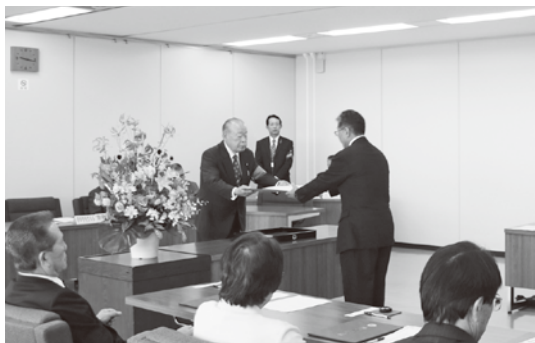
▲当選証書付与式の様子

任期満了に伴う幸田町議会議員一般選挙は、無投票となり、下記の16人が当選しました。