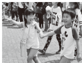
▲わくわくキッズフェスティバルより

取材活動で日焼けした効果なのか、「やせたね」とやせてないの に言われる編集者のKです。 心地よい春の風はあつという間 に通り過ぎ、暑い日がやってきま した。先月の大きなイベントで は、ゴールデンウィーク中にハッ ピネス・ヒル・幸田で開催され た、わくわくキッズフェスティバ ルがありました。今月号のまちか どフォトニュースでも紹介してい ますが、移動販売を行うキッチン カーの出店が 多数あり、会 場のあちこち に行列ができ ていました。 青空の下で食 べると2割増 しておいしく 感じるのにな ぜなのでしょう。まちかどフォト ニュースでは紹介できなかった僕 のお気に入りの一枚をご紹介します。 さて、来月号では、小学校の運 動会や消防団の競練会の様子をご 紹介したいと思います。体が熱さ に慣れていない時期が、熱中症に なりやすいようです。水分補給や 帽子で日差しをさけるなど、倒れ ないように取材活動頑張ります！ (K)