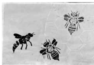
「すを守るハチ」 【紙版画】

先生から ローラーの向きを考えて、さわやかな秋の風の動きを表現することができましたね。帽子も2つの色を使った工夫がいいですね。