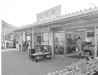
▲改装された屋外直売所