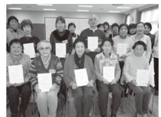
▲中央学区げんきかいの様子 (げんきかいでは認知症予防にも取り組んでいます)

認知症は誰にでも起こりうる脳の病気によるもので、85歳以上では4人に1人にその症状があるといわれています。認知症は、あなたの身近な問題で人ごとではないのです。