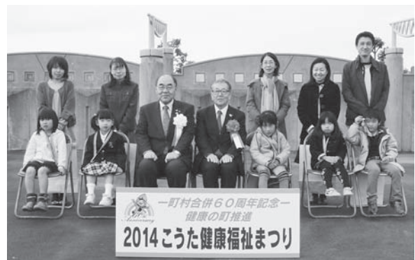
▲親子良い歯コンクール受賞者の皆さん