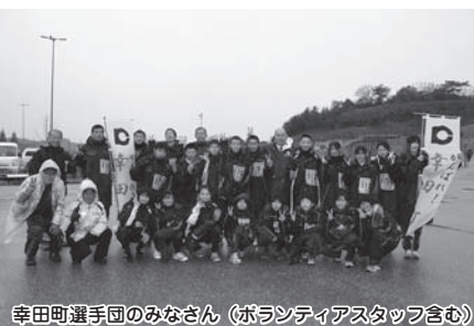
幸田町選手団のみなさん (ボランティアスタッフ含む)