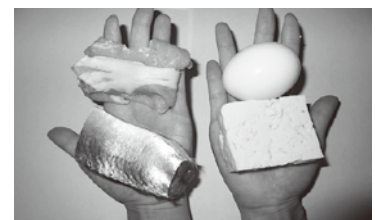
▲1日に必要な肉、魚、卵、豆腐