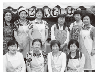
▲食育推進ボランティア 「ひまわり」

年齢と共に、食事の量が減ったり、食事の支度 がめんどうになって、かたよった食事になってい ませんか?その結果、気づかぬうちに「低栄養 状態」になり、運動能力や気力が低下し、転倒、 骨折、認知症を誘発することがあります。高齢期 には低栄養にならないように注意しましょう。