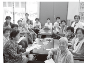
▲東部いきいきサロ ンにてロコモチェク

筋肉、骨、関節、軟骨などの動きが衰え「運動 器の障がい」の進行により介護が必要となるリス クが高くなっている状態を「ロコモティブシンド ローム(略称:ロコモ)」といいます。いつまで も自分の足で歩き続けていくために、運動器を長 持ちさせ、ロコモを予防し、健康寿命を延ばしま しょう！