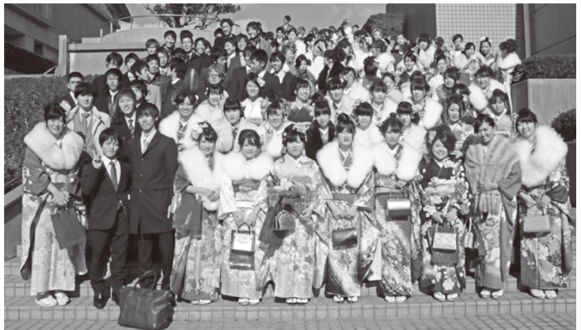
▲昨年度、第67回成人式より