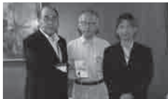
▲エムアールシー幸田(株) 贈呈式