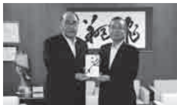
▲西尾信用金庫 贈呈式

/災害時非常用浄水装置20台 フタバ産業(株)/ドライブレコーダー25台 トーテックアメニティ(株)/金100,000円 トーテックビジネスサポート(株) /金50,000円