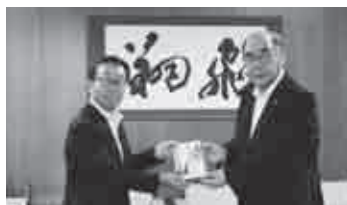
▲フタバ産業(株) 贈呈式