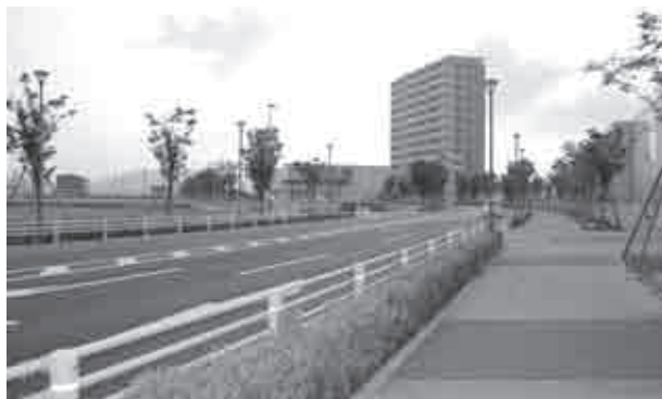
▲さらなる整備が進む相見駅周辺

平成15年にオープンしたカメラガーデン幸田をはじめとする商業施設の立地、平成19年に開通した相見線（あいみ通り）、そして平成24年に相見駅開業など、幸田町の北の玄関口として計画的なまちづくりが進んでいます。