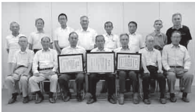
▲幸田相見特定土地区画整理組合役員の皆さん