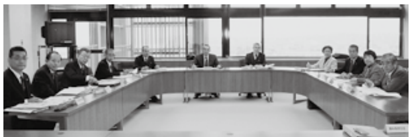
▲幸田町議会報告会推進会議委員