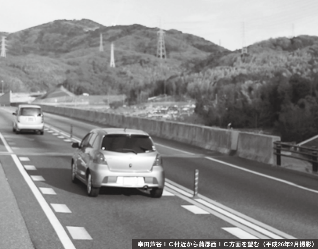
幸田芦谷 I.C. 付近から蒲郡西 I.C. 方面を望む (平成26年2月撮影)