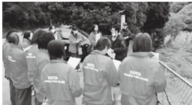
▲深溝断層を見学している様子

申 込 み 2月28日(金)までに、消防本部予防防災課(☎63-0513)までご連絡ください。