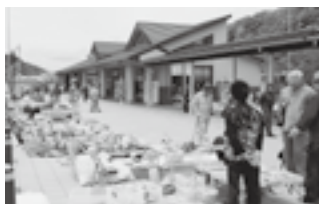
▲フリーマーケットの様子