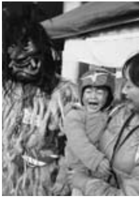
▲別ショットの写真

今月の表紙は、昨年12月22日に道の駅筆柿の里・幸田で開催されたイベントです。カニ汁の無料提供や、秋田名物のきりたんぼ鍋の販売が行われました。すると突然、会場に「なまはげ」が登場。道の駅にいた子どもたちは泣いたり、びっくりしながらも、なまはげとの写真撮影などを楽しみました。