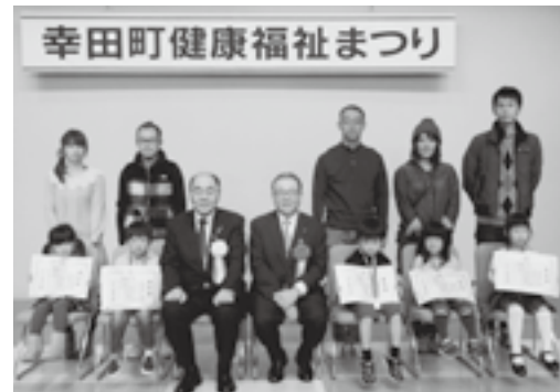
▲親子良い歯コンクール受賞者の皆さん