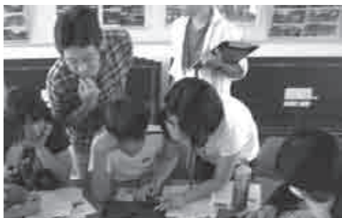
▲タブレットを使って災害危険度をチェック

12時30分からまち歩きに参加したP T Aの関係者など約50人が集まり、文部科学省が実施している「地域防災対策支援研究プロジェクト」のワークショップに参加しました。ワークショップでは4つのグループに分かれ、タブレットやプロジェクターに映し出された古地図やハザードマップなどを見ながら、まちの歴史や災害危険度を地図におとし、午前中のまち歩きで気が付いたことや深溝学区で心配なことなどをあげ、幸田町の現状について討論しました。