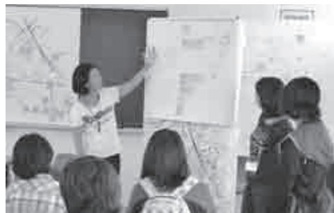
▲各グループでまとめた意見を発表