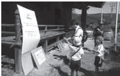
▲防災クイズに挑戦！

午前9時深溝小学校のグラウンドをスタートした児童と保護者らは、深溝断層、浄圓寺、円超寺などのチェックポイントに立ち寄り、幸田町の文化や歴史に触れ、用意された防災クイズなどのイベントを通して防災について学びました。危険地域等の防災だけでなく、幸田町の産業や魅力に触れました。