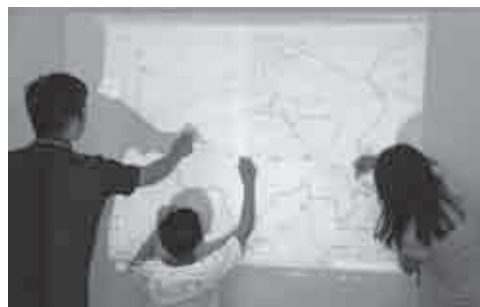
▲プロジェクターを使って地図を作成

討論では防災対策などについて話し合い、将来自分たちができること「自助」、地域としてできること「共助」、行政にしてもらいたいこと「公助」について、発表して頂きました。