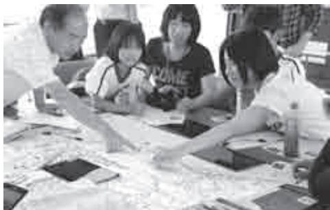
▲危険個所の対策について話し合い

次に近い将来必ず発生すると危惧される南海トラフの巨大地震などや自然災害に対する地域の課題、減災のためのまちづくりのために活発な意見が出されました。