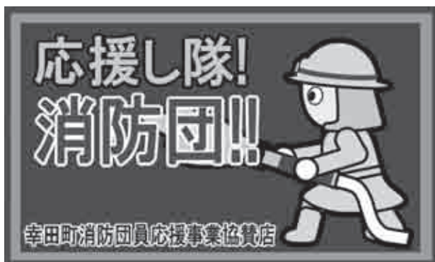
▲応援事業協賛店のステッカー

幸田町消防団員応援事業の詳細は幸田町ホームページ→救急・消防→お知らせ→「幸田町消防団員応援事業を始めます」でご覧いただけます。登録を希望される場合は下記までご連絡ください。