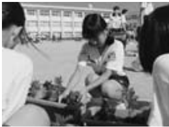
▲マリールーゴルドの植え替え

また、自分たちの住む地域をきれいにし、気持ちよく生活ができるようにと願い、ゴミ回収も行っています。