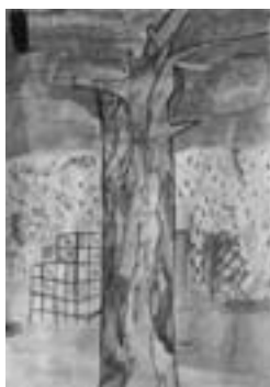
「大きくりっぱなハナノキ」 【水彩版】