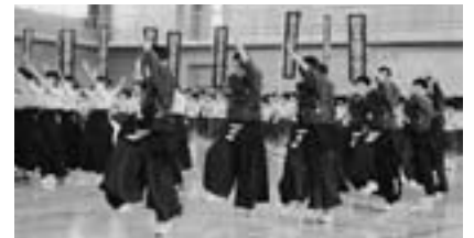
(上) 全力で行進する選手の姿 (下) 全力行進に応える全力エール