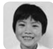
1年 くさつく えり 草次 映里 さん

先生から すきまがないように、力をこめてぬることができました。足の先やはさみのかたちをよく見てかき、色も工夫してあります。