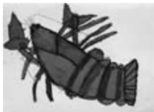
ザリガニの「がいどくん」 【クレヨン画】

先生から 大きくりっぱにかけていて、迫力があります。手前の木の幹の様子までくわしくかけました。