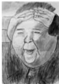
あ〜あ、やっちゃったみたい 【鉛筆画】

先生から スポーツマンタイプの友達でしょうか? ストレートな叫びをスピード感ある線や影で表現することができています。