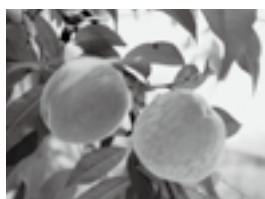
▲7月最盛期となる桃