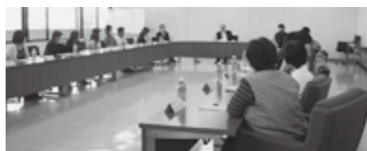
▲（上）地域安全女性推進委員の皆さん （下）会議の様子