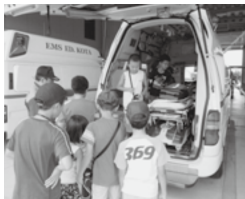
▲昨年は救急車の中も見学しました!