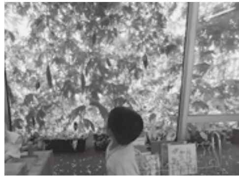
▲大草保育園 室内からみたカーテン