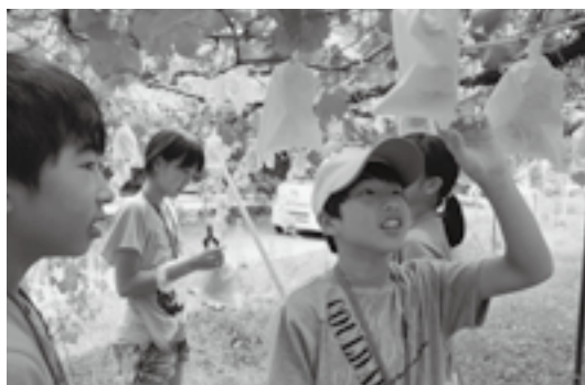
▲昨年度のぶどう収穫体験の様子

と き 8月14日(水) 午前9時～午後3時30分 ところ 町内農場・農業施設など 内容 ぶどう・なすの収穫体験や農協の施設見学、カレーライス作り 主催 幸田町青年農業会議 対象 町内在住の小学4年～6年生 定員 15組(30人)*2人1組、応募者多数時は抽選を行い、抽選結果を全員へ郵送で通知します。 参加費 500円/人(昼食原材料費・傷害保険料を含む) 申込み 7月1日(月)から12日(金)までに、産業振興課農業振興G(内線264)、または、JAあいち三河(町内の各支店)へお申し込みください。なお、申込み用紙は小学校から配布されます。