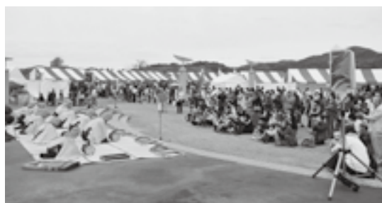
▲昨年度の中央小による三河万歳