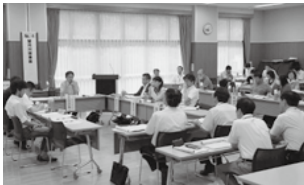
▲昨年度の事業仕分け

と き 8月11日(日) 午前9時～午後3時(予定) と ころ 中央公民館 内 容 事業仕分け(対象事業3事業程度) 平成23・24年度実施事業現状報告会