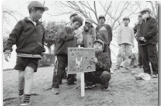
▲みんなの広場、きれいに保ちましょう!