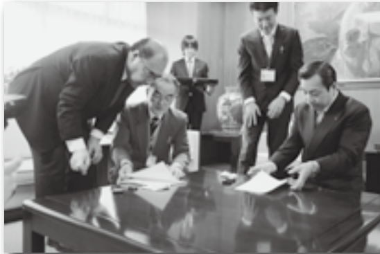
▲協定締結式の様子

東海・東南海・南海地震や風水害などの大規模災害に備え、県産業廃棄物協会と「災害時における廃棄物の処理等に関する協定」を締結しました。災害時に生じたがれきや生活ごみの撤去、収集などを迅速に処理し、早期災害復興を目指すもので、県下町村で第1号の協定締結となりました。