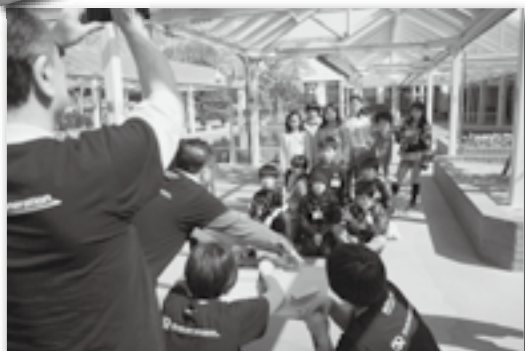
▲デジカメを左右に6cmずらして2枚撮影