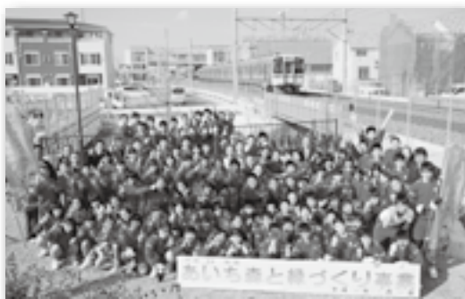
▲相見駅と電車をバックに記念撮影♪