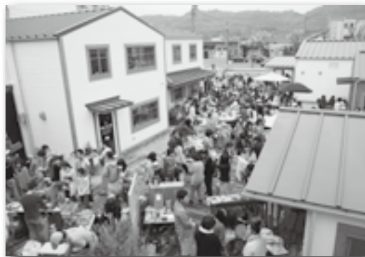
▲客足が途絶えることはありませんでした♪