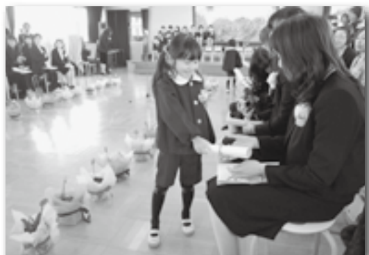
▲ママ、がんばったよ♪（わした）

町内の保育園で卒園式が行われました。わした保育園では、卒園証書を立派に受け取った園児が保護者の元へと歩き、証書を手渡しました。そのあと、卒園児による「がんばってきたこと発表会」があり、園児が今まで頑張ってきた竹馬、跳び箱、鉄棒、コマ回しなどの特技を保護者の前で発表し、何度失敗しても成功するまであきらめない姿に温かい拍手が送られ、涙する保護者の姿も多くみられました。