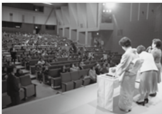
▲会場は多くの人でにぎわいました！

毎年恒例のこうた女性大会が町民会館つばきホールで盛大に開催されました。事例発表や新役員の紹介、アトラクションでは津軽三味線の演奏や豪華景品が当たる抽選会などが行われました。大会のフィナーレには新作衣装に身を包んだモデルによるブライダルショーが開催され、会場は大きな拍手に包まれました。