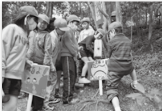
▲急な坂道に看板を設置しました!

4月1日から始まるしだれ桜まつりを安全に楽しんでもらおうと、荻谷小の4年生67人が園内の危険と思われる場所などに手作りの看板を設置しました。看板には「すべるから危ない!」「ゴミは持ち帰ろう」などの文字と一緒にカラフルな分かりやすいイラストも描かれています。また、そのほかにも園内の樹木に腐葉土をまき、パンジーの花も植えました。