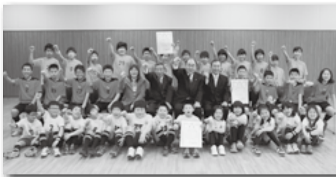
▲3チームそろって記念撮影