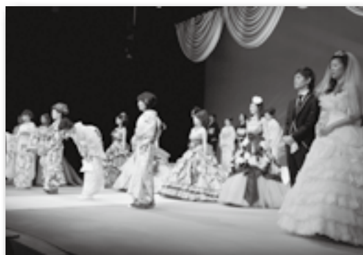
▲大好評のブライダルショー♪