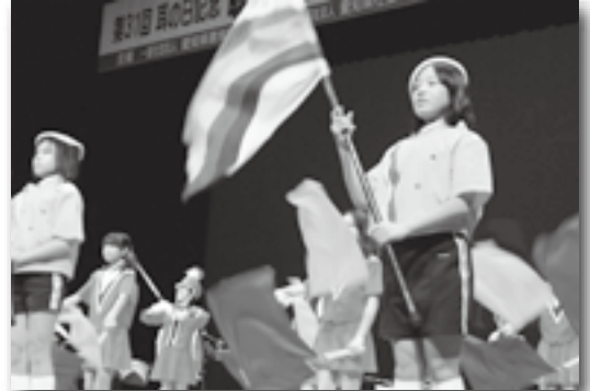
▲荻谷小の児童によるマーチングバンド