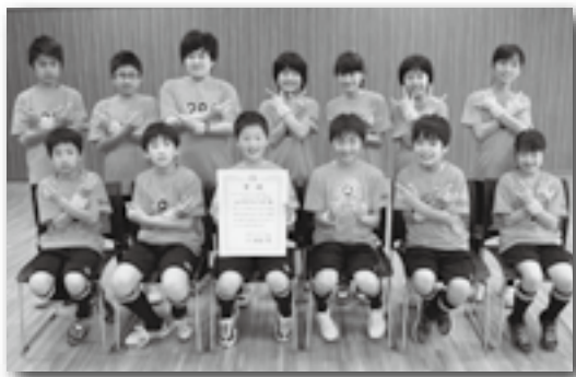
▲全国優勝したトヨサカブラックス

千葉県浦安市で開催された日本小学生ネオホッケー選手権2013で豊坂小のトヨサカブラックスが高学年の部で優勝しました。また、坂崎小の坂崎ストロングが同部3位、豊坂小のトヨサカイグルスが低学年の部で3位という成績を収めました。ネオホッケーとは、幸田町で盛んなユニバーサルホッケーの新名称で、スティックやボールも今までのものと異なります。選手たちは、新競技となっても自分たちの持っている力を存分に発揮し、全国大会で大活躍しました。