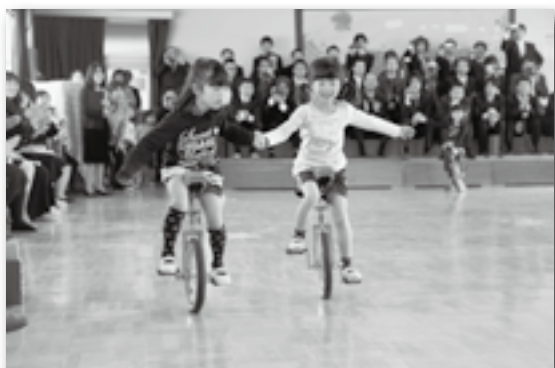
▲一輪車にも乗れるようになったんだよ♪（わした）