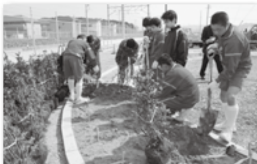
どこに植えるときれいに見えるかなあ

北部中学校の1年生121人が、相見駅西側の7号公園でキリシマツツジやハツユキカズラなど約1,600本を植樹しました。苗木や花の苗を大事に扱いながら、生徒同士が協力してていねいに植える様子が見られました。生徒たちは中学校入学からおよそ1年、相見駅も開業から約1年。このタイミングで公園づくりにかかわることができた生徒たちは、自分の植えた苗木の位置をしっかりと覚え、またいつか見に来ようと話していました。