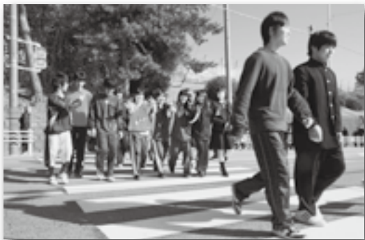
▲点灯式に参加した生徒による渡り初め