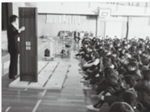
▲講演会では長机を倒して家具が倒れた時の威力を体感しました！