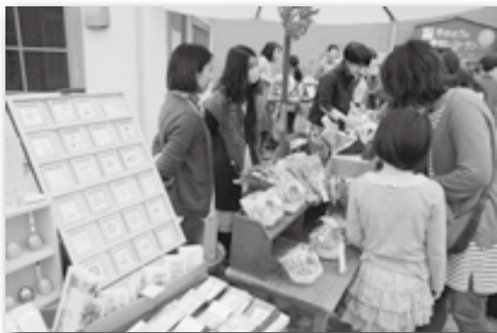
▲こだわりのすてきな商品がたくさん♪

幸田駅前銀座で「海辺百貨店」というイベントが初めて開催されました。西尾市の「うみじかん」というグループが主催で、県内外から27の露店が幸田駅前銀座に集結しました。雑貨、コーヒーやカプチーノ、ステンドグラス、手作りアクセサリ、陶器、アロマクラフトなどこだわりのおしゃれな商品がいっぱいで、午前10時の開店から午後3時の閉店まで、終始多くのお客さんでにぎわっていました。