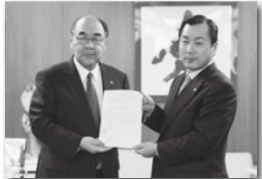
▲県内の町村で初めての協定締結