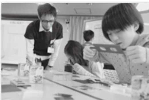
▲立体的に見えたかな？