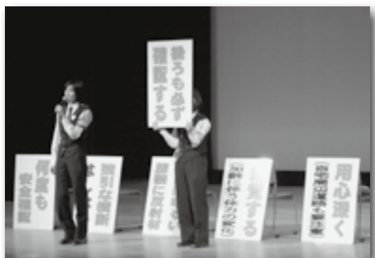
▲「あゆみ」による交通安全教室