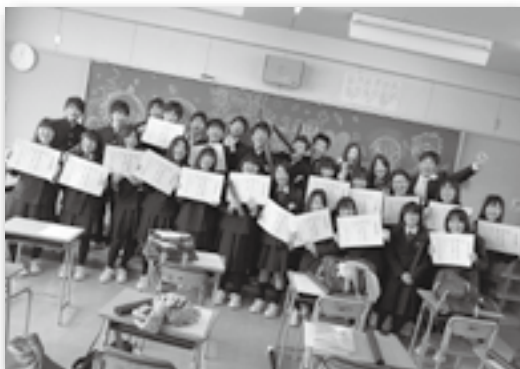
▲最後に教室で記念撮影♪