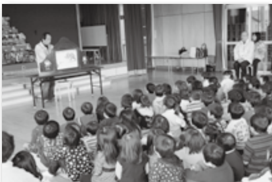
▲紙芝居に夢中の園児たち♪