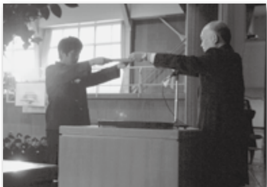
▲卒業証書を受け取る生徒

幸田高校で卒業式が行われました。卒業証書授与などが終わり、退場の時間を迎えると卒業生らは起立し、体育館中に響き渡る大きな声でみんなで「ありがとうございました！」とあいさつをしました。教室に戻ると、友人や同級生と写真撮影をしたり、卒業アルバムにメッセージを書きあったりし、3年間を過ごした幸田高校へ笑顔で別れを告げていました。