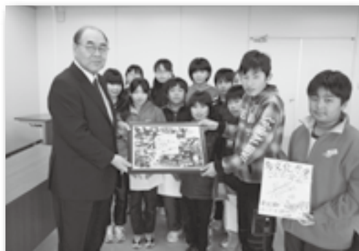
▲報告に訪れた中央小の児童