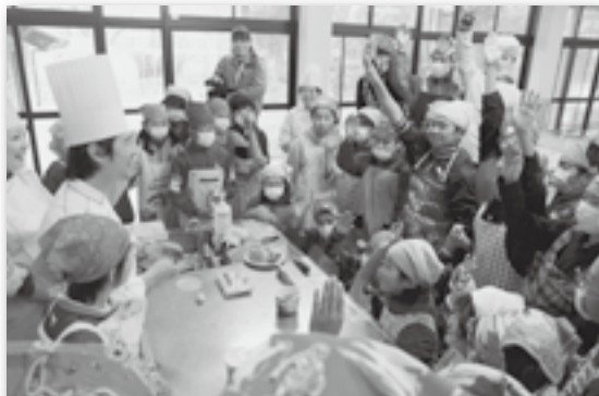
▲マジパン（ケーキの飾り）づくりも教わりました！

坂崎小学校の6年生が幸田町大草にあるケーキ屋さん「クリーム」の店長さんや従業員の皆さんを講師に招き、ケーキ作りをしました。いちごジャムの作り方から、そのジャムを練り込んだマフィンの作り方を教えてもらい、教室のオーブンで焼き上げると、たちまちおいしそうな甘い香りが教室中に広がりました。体験した児童は、「分量が難しかったけど上手にできた。バターを混ぜるのが大変だった」と話してくれました。