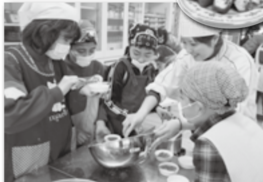
▲とっても本格的でしたね♪