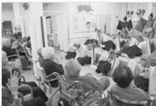
▲見事な舞に拍手を送る施設利用者の皆さん

中央小学校の三河万歳クラブの子どもたちが芦谷区にある在宅介護サービス施設「たいよう」を訪れ、三河万歳を披露しました。子どもたちが色鮮やかな衣装を身にまとい、御殿万歳というめでたい舞を披露すると、それを見たおじいさんおばあさんは「よく覚えたね」、「とってもよかったよ」などと声を掛け、中には涙を見せる人もいました。最後には子どもとおじいさんおばあさんみんなで握手をかわし、心があたたまる交流会となりました。