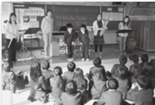
▲楽器の演奏も体験しました♪（深溝）

町内の小学3年生を対象に音楽宅配事業が行われました。今回は、打楽器・ユーフォonium・フルート・コントラバスの奏者が生演奏などを披露しました。児童は音に合わせて体を動かしたり、曲を聞いてどんなイメージを感じたか話したりしました。深溝小学校の女子児童の1人は「本物の楽器の音はきれいで、楽しかった」と話してくれました。