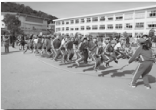
▲クラス一丸となって頑張りました！