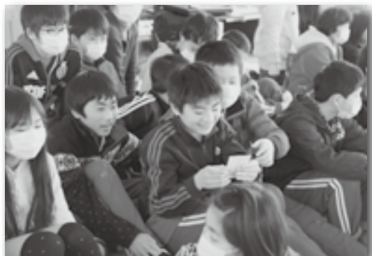
▲本物の投票用紙が破れにくいことに驚く児童