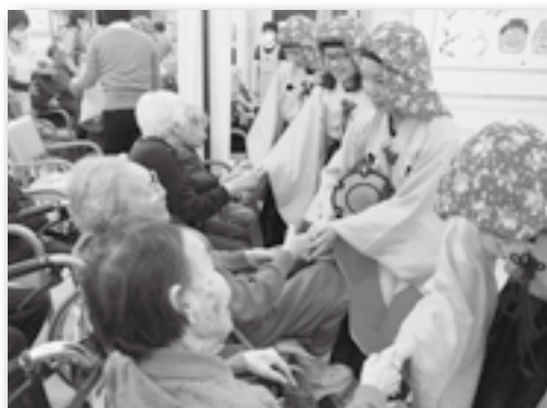
▲「上手だったよ。また来てね」