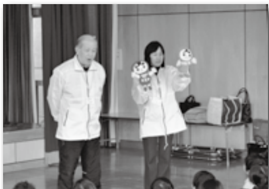
▲人形も使ってお話ししました♪

幸田町の人権擁護委員である6人が、町内の保育園で紙芝居や寸劇などで、園児との交流をはかりました。27日は幸田保育園を訪れ、「みんな仲良く」というテーマのもと2つの紙芝居を園児に読み聞かせると、園児たちは時折大笑いしながら楽しく「仲良くすることの大切さ」を学び、とてもにぎやかな交流会となりました。