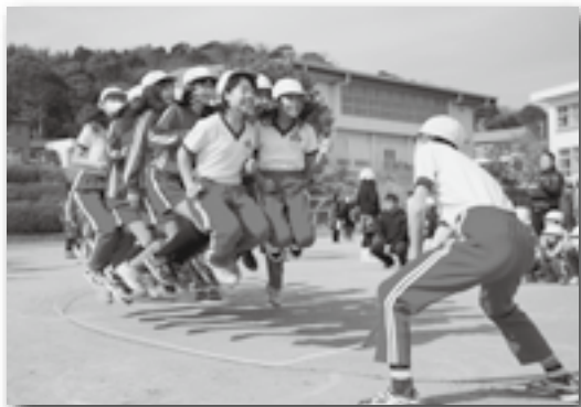
▲目標回数は達成できたかな？

豊坂小学校で毎年恒例の縄跳び大会が行われました。この日までにクラスごとに練習を重ね、本番ではそれぞれのクラスごとに目標回数を決めて大縄跳びに挑みました。保護者が見守る中、子どもたちは大きな声で回数を数えながら元気いっぱいに縄跳びを楽しみました。