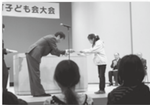
▲書き初め入賞者の表彰