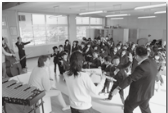
▲演奏に合わせて踊りました♪（深溝）