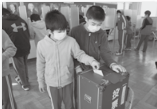
▲投票を体験しました♪

役場の総務課の職員が豊坂小学校を訪れ、6年生を対象に選挙の授業をしました。職員2人が立候補者のように演説し、児童はどちらの候補者がいいか選んで、実際の選挙のように受付や投票用紙の交付係を体験したり、実際に使われる投票箱に投票したりしました。選挙が自分たちの暮らしにいかに大切なものであるかを知るいい機会となりました。