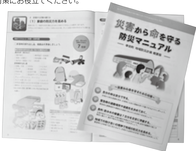
▲広報紙と一緒に配布された災害から命を守る防災マニュアル

ぜひ皆さまにご覧いただき、災害への事前の備えや災害時の行動に関する情報源として「常に手の届くところ」にご準備いただき、家庭での減災・防災対策にお役立てください。