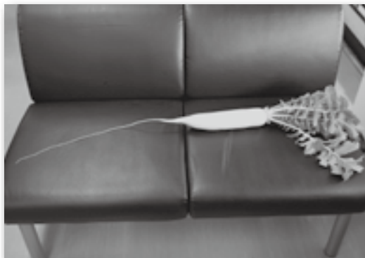
▲わかりやすいように黒いイスに置いて撮影したもの