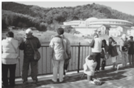
▲池の周りにも野鳥がたくさん（野場）

町内で野鳥観察会が行われ19人が参加しました。双眼鏡を除くと池の周りにカモなどの姿が見られ、参加者の皆さんは野鳥を観察しながら講師の説明に耳をかたむけていました。中央公園では、木の枝にとまる小鳥も観察できました。講師の説明によると、冬鳥は北の国からやってきて、日本で冬を過ごし、春になると北の国に戻ってそこでヒナを育てるそうです。