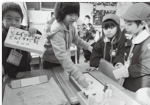
▲どんぐりのボウリングだよ♪

幸田小学校の1年生が大草保育園の年長児を校内に招き、自分たちで拾った秋の木の葉や落ち葉で作ったゲームで遊ぶ交流会を開催しました。児童たちは松ぼっくりを使ったけん玉やどんぐりを転がす迷路などを作り、園児たちに遊び方を教えてあげたり、目標をクリアした園児には手作りの折り紙のおもちゃをあげたりしながら楽しい時間を過ごしました。