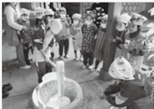
▲「よいしょー！」とみんなでお餅をつきました！