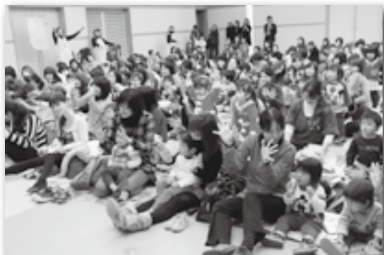
▲たくさんの親子が訪れました！

町民会館あじさいホールで親子ふれあいクリスマス会が開催され、124組の親子が参加しました。歌に合わせて手遊びをしたり、生バンドの演奏で「アンパンマンのマーチ」を聴いたりして過ごし、最後にサンタクロースからプレゼントを受け取って、笑顔いっぱいのクリスマス会になりました。