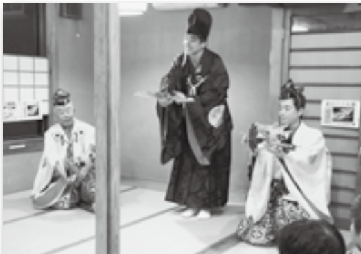
▲はかま姿の太夫（中央）と才蔵（両端）

1月1日～3日に幸田町三河万歳保存会の3人が町内各地の民家や飲食店で三河万歳の演舞を披露しました。2日には横落区のうどん屋「季龍」に訪れた大勢の観客の前で、最もおめでたい「御殿万歳」が披露され、新春のめでたい舞に大きな拍手が送られました。