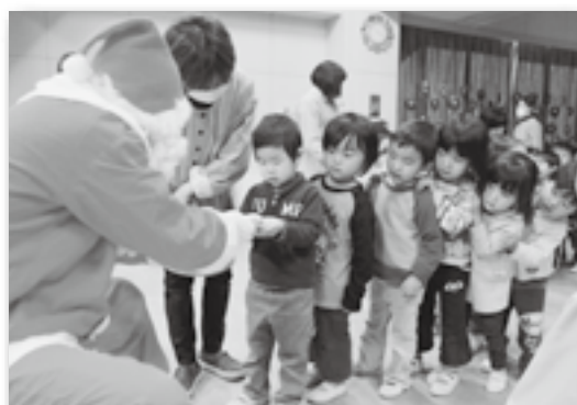
▲サンタさんからのプレゼントも♪