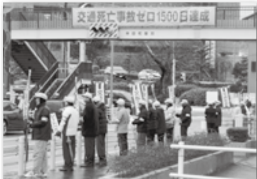
▲雪が降る中での街頭啓発活動となりました！

平成 20 年 10 月 27 日から続いている警察の統計上の交通死亡事故ゼロ継続日数が 12 月 4 日をもって 1500 日となったことを契機に、悲惨な交通事故の撲滅を目指し、区長、老人クラブ連合会長、PTA 連絡協議会長、警察、町職員など総勢 66 人による交通安全街頭啓発活動を行いました。参加者は、のぼり旗、啓発板を手に、登校中の児童・生徒や通行車両のドライバーに交通安全を呼び掛けました。