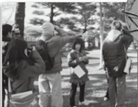
▲中央公園にも野鳥がいました♪