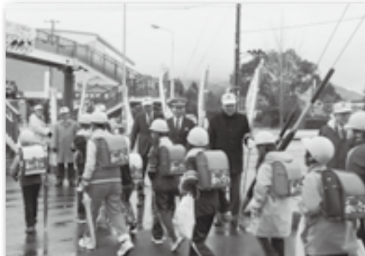
▲登校中の児童にも交通安全を呼び掛けました。