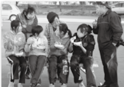
▲一緒についたお餅を食べながらの会話も楽しいですね♪