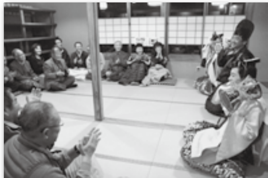
▲演舞を見て楽しむ皆さん