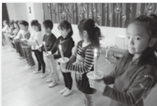
▲キャンドルがとっても幻想的☆

豊坂保育園でクリスマス会が開催されました。会場の遊戯室は園児たちが作ったリースや松ぼっくりのツリーで飾り付けがされ、年長児たちがキャンドルを手に年中・年少児たちを迎え入れました。保育士によるハンドベル演奏、サンタクロースへの質問タイム、園児たちがクリスマスの歌を歌うなど、手作りで温かなクリスマス会となりました。