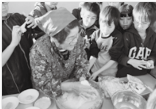
▲つきたてのお餅の上手なちぎり方も教えてもらいました♪