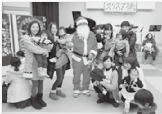
▲サンタさんと一緒にハイ、チーズ♪