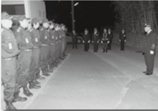
▲詰所巡回の様子（第1分団）

27日・28日の2日間にわたり、消防団を中心とした年末夜警が町内全域で行われました。大須賀町長をはじめ岡崎警察署長、西三河県民事務所長、県議会議員なども町内8つの消防団詰所を訪れ、気ぜわしくなる年末の特別警戒にあたりました。これからの季節、火の取り扱いには十分注意しましょう！