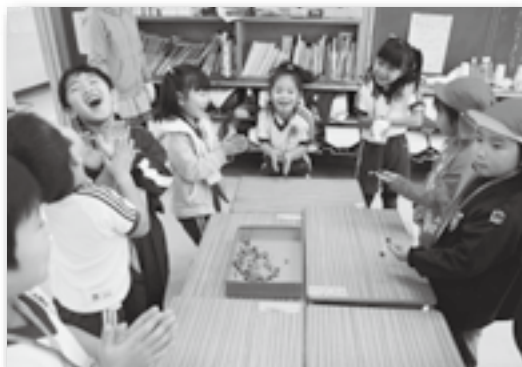
▲どんぐりのやじろべえ、歌が終わるまで上手に乗せてね♪