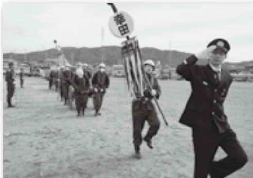
▲分列行進で凛々しい表情を見せる団員