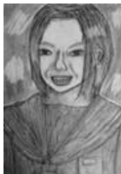
いつも笑っている私 【鉛筆画・自画像】

先生から 画面に大きく描いたことで迫力が出ています。開いた口は歯が見え、ふとした時の表情が出せました。