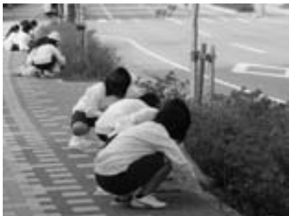
▲「あいま通り」清掃活動

掛け、貴重な体験をさせていただきました。出発前に、保護者や町に協力をいただき、カレー粉やレトルト食品などの食材をたくさん集め、持って行きました。 さらに、夏休みには、上六栗子育て支援センターで育児ボランティア活動を行いました。また、10月の連休中に、岡崎盲学校の体育祭で運営ボランティア活動を行いました。