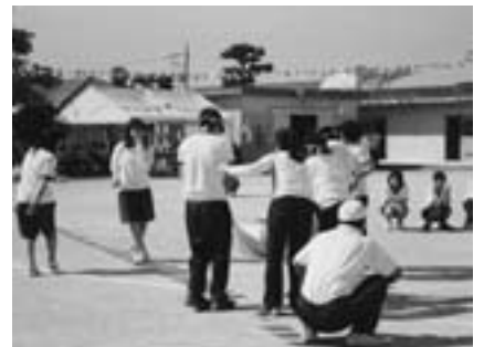
▲岡崎盲学校体育祭