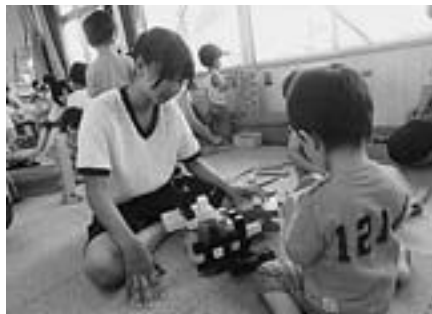
▲育児ふれあい体験