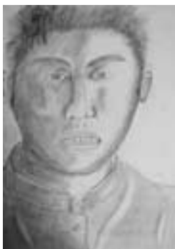
笑っている自分 【鉛筆画・自画像】