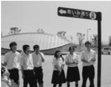
▲「あいま通り」除幕式

幸田高校生、ボランティア活動頑張っています！ 幸田高校生は、勉強や部活動はもちろんのこと、幸田町唯一の高校として、ボランティア活動も頑張っています。 まず、相見駅の新設とともに、昨年6月29日に「あいま通り」除幕式に参加しました。