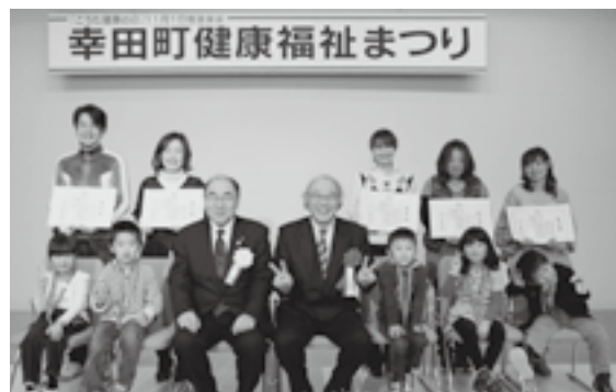
▲親子良い歯コンクール受賞者の皆さん