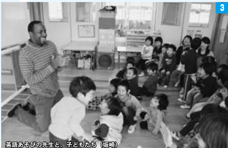
英語あそびの先生と、子どもたち（坂崎）