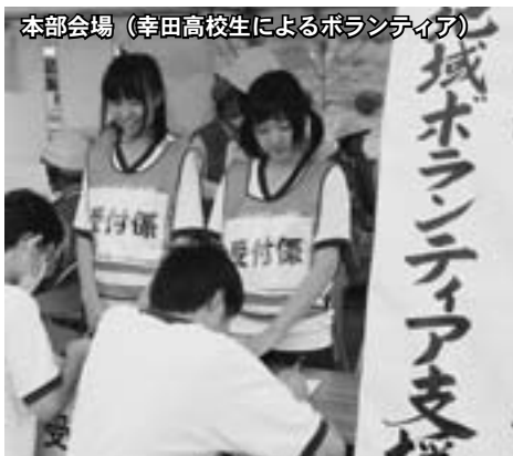
本部会場（幸田高校生によるボランティア）