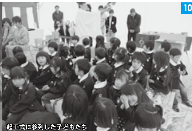
起工式に参列した子どもたち