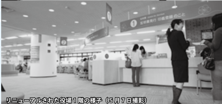
リニューアルされた役場1階の様子（5月7日撮影）