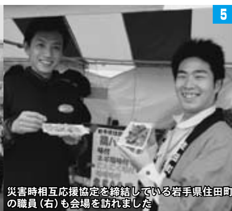
災害時相互応援協定を締結している岩手県住田町の職員（右）も会場を訪れました