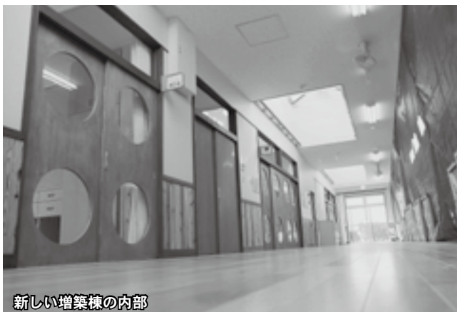
新しい増築棟の内部