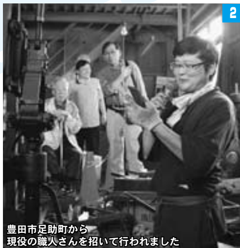
豊田市足助町から 現役の職人さんを招いて行われました