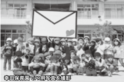
幸田保育園でPR用写真を撮影