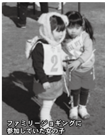
ファミリージョギングに 参加していた女の子