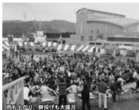
雨も上がり、餅投げ也大盛況