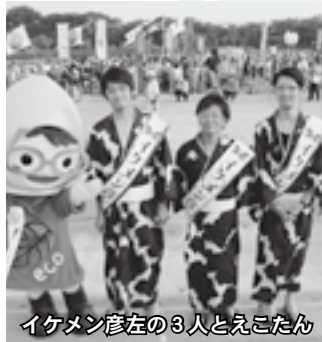
イケメン彦左の3人とえごたん