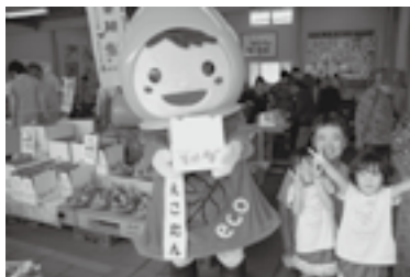
▲筆柿まつりの様子