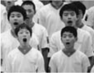
▲はじめの会での全校合唱

今年度一学期中に2度の交流会が行われ、両日とも12の講座に40人以上の講師さんをお招きしました。はじめの会では、講師の皆さんに感謝の気持ちを表そうと全校合唱「南風」