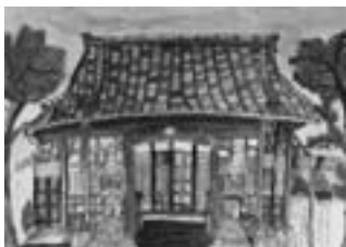
歴史を重ねた正楽寺 【水彩画】

先生から 影になっている部分を絵の具の濃淡で上手に表現し、立体感を出すことができました。由緒ある正楽寺の建物をていねいに描きあげました。