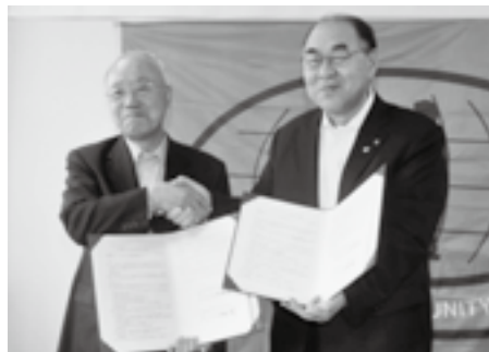
▲協定締結の様子(箕輪町役場)

今回の災害時相互応援協定先である箕輪町は、5月12日に全国町村では、初めてWHO(世界保健機構)からセーフコミュニティ認証を受けています。