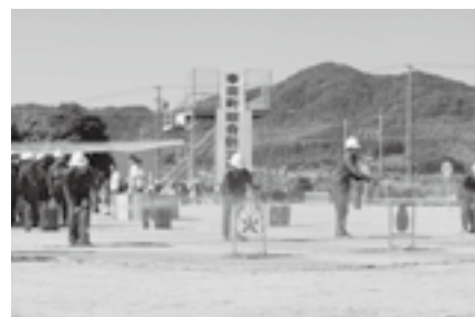
▲初期消火訓練の様子（平成22年度）