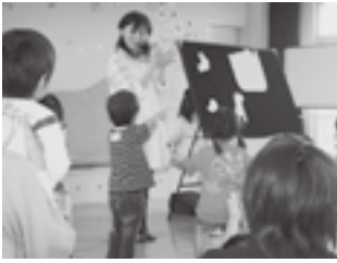
わくわくあそびランド