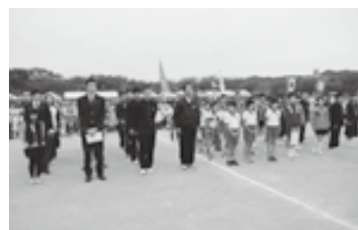
▲表彰式の様子(10月28日)