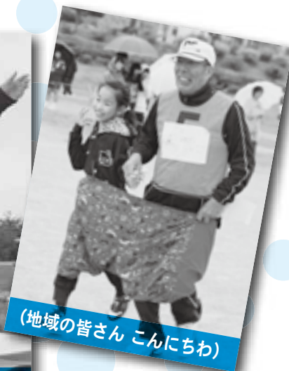
(地域の皆さん こんにちは)