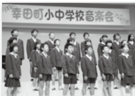
▲見事なハーモニーでした♪（深溝小）