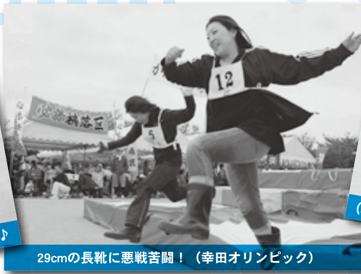
29cmの長靴に悪戦苦闘! (幸田オリンピック)