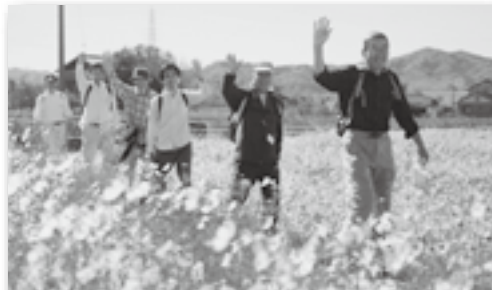
▲コスモス畑で ハイ、チーズ♪