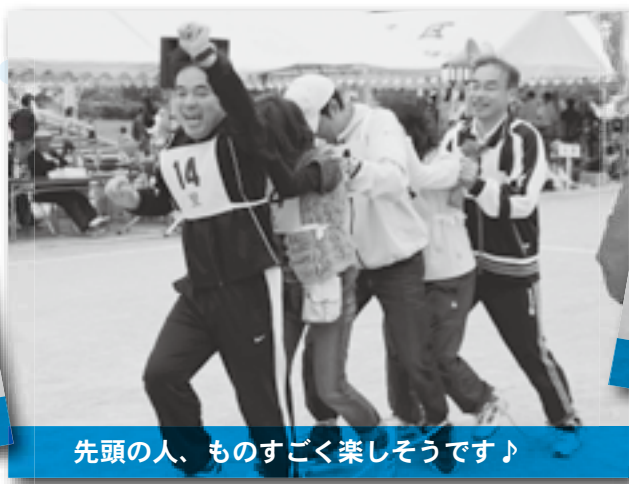
先頭の人、ものすごく楽しそうです♪