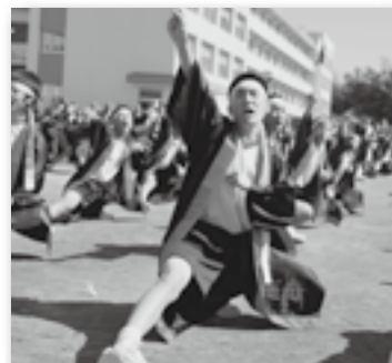
▲華麗で力強い 南中ソーラン