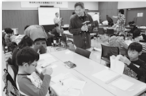
▲オリジナル紙とんぼ制作中♪

中央公民館で幸田町少年少女発明クラブ発足式開催後、第1回目のクラブ活動が開催され、町内に住む小学4年生から6年生のクラブ員27人(全32人)が出席しました。クラブ活動では、「身近な材料で飛ぶものを作ろう」というテーマで、竹トンボを模した紙トンボを一人一人の発想で作っていました。今後、町内企業で働く社員や大学の先生などを指導員に迎え、工作を通じて科学的な発想力を養っていきます。