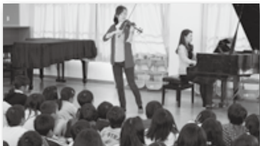
▲幸田小学校の様子