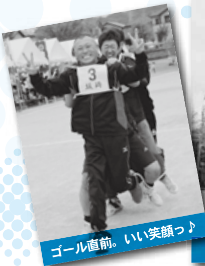
ゴール直前。いい笑顔っ♪