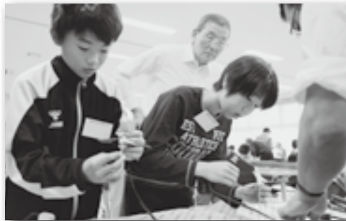
▲グルーガンを使うなんておもしろいね！