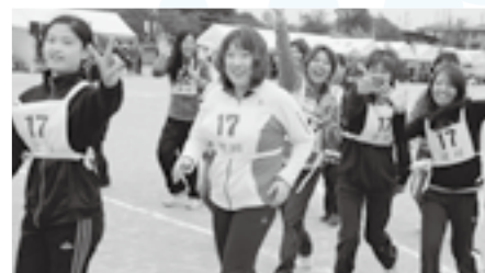
カメラを向けるとステキな笑顔が♪