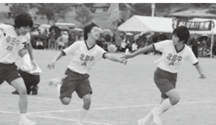
見事なチームワークを見せた 中学校対抗リレー女子の部