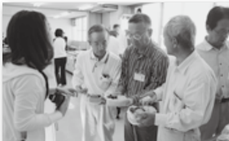
▲栄養師さんによるお弁当チェック。 意外とむずかしいですね…

できる男の健康料理塾が保健センターで開催されました。この日は、お弁当を使った健康料理について学び、カロリーを気にしながらの弁当詰めを体験。講師からウォーキングの正しい歩き方を教えてもらい、自分で詰めたお弁当を持ってさっそく町民会館に向けてウォーキングに出掛けました。参加者同士、楽しく会話を弾ませながら歩いていると、目的地の町民会館にはご褒美のようなコスモス畑が広がり、参加者らは顔をほころばせていました。