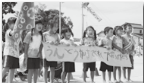
▲うんどうかいきてくれてありがとう！(大草)

10月6日に坂崎・大草・わした・菱池・幸田・豊坂、13日に里・深溝保育園で運動会が開催されました。園児らはこの日のために練習した踊りを披露したり、リレーでは裸足で力いっぱい運動場を走りました。保護者と一緒に出場する競技では、保護者の手を元気にひっぱって走る姿も見られ、会場には笑い声と歓声があふれていました。