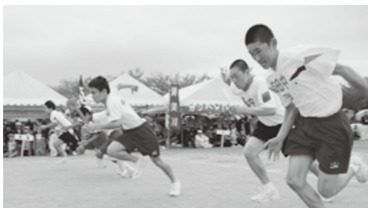
力強い走りを見せた 中学校対抗リレー男子の部