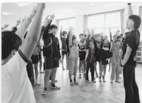
▲歌もダンスも楽しくできたね☆（中央小）