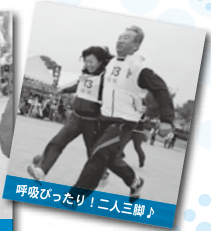
呼吸ぴったり！二人三脚♪