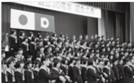
▲手話も交えた全校合唱「南風」

南部中学校が開校30周年を迎え、記念式典を開催しました。式典では、生徒たち手作りのくす玉が開かれ、同校卒業生3人によるオペラの演奏・歌の披露も行われました。また全校生徒による南部中学校の合唱曲「南風」や南中ソーランも披露され、訪れた人たちからは南中のさらなる「飛翔」に期待を込めた大きな拍手が贈られていました。