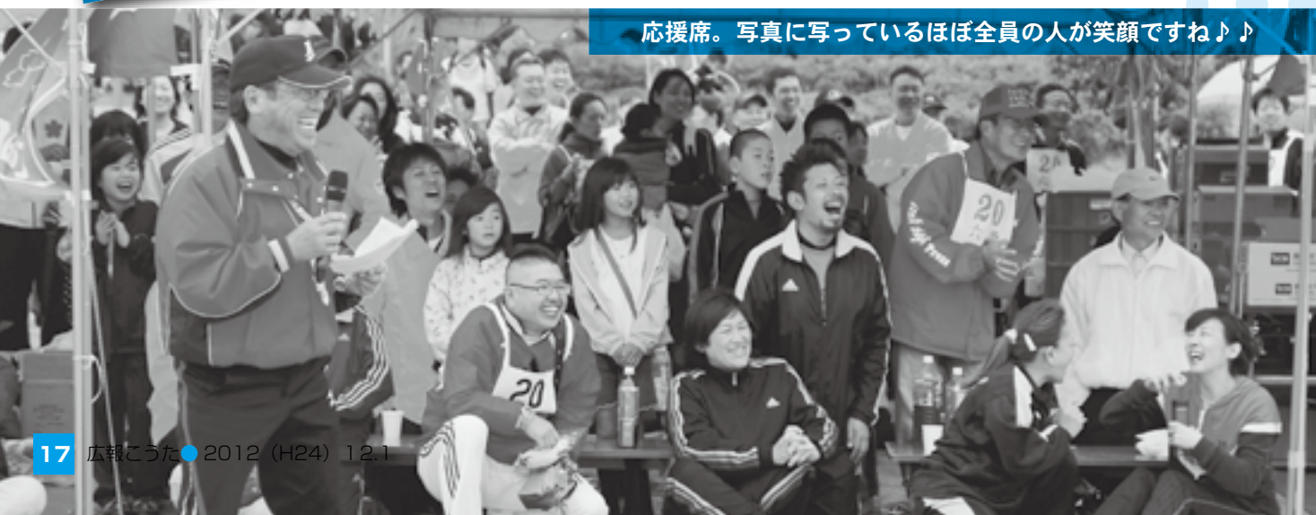
応援席。写真に写っているほぼ全員の方が笑顔ですね♪♪