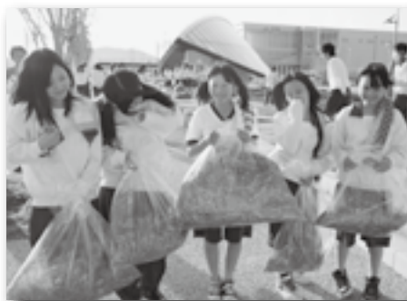
▲雑草で袋はすぐいっぱい！

幸田高校の1年生237人がJR相見駅から同校までを結ぶ「あいみ通り」の清掃活動を行いました。開業前に植樹した木々の根元に生えた雑草を抜いたり、ごみを拾ったりしました。参加した生徒の1人は、「服とかも汚れたけど、そんなことよりもまたやりたいと思った！」と元気に話してくれました。