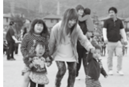
ここまでおいで♪ …あれ？