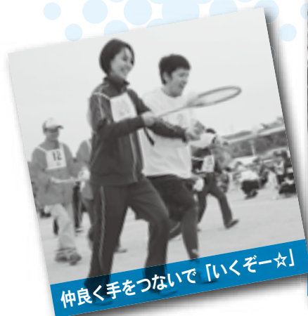
仲良く手をつないで「いくぞー☆」