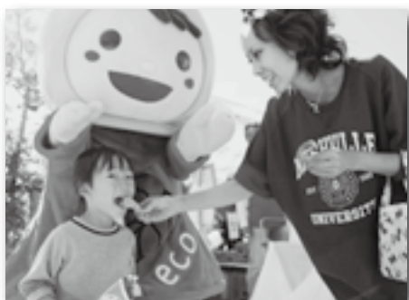
▲試食コーナーに えこたん登場♪