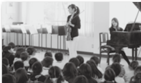
▲荻谷小学校の様子