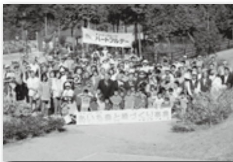
▲参加者全員で記念撮影