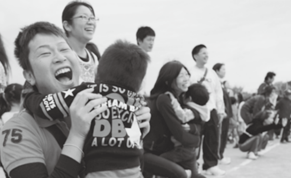
パパのもとまで無事にとぅちゃーく♪ (ここまでおいで)