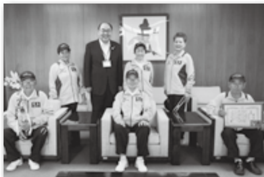
▲おそろいのユニフォームがステキです！