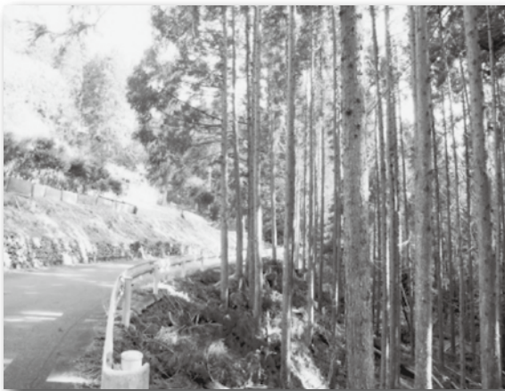
▲人工林整備(新城市)