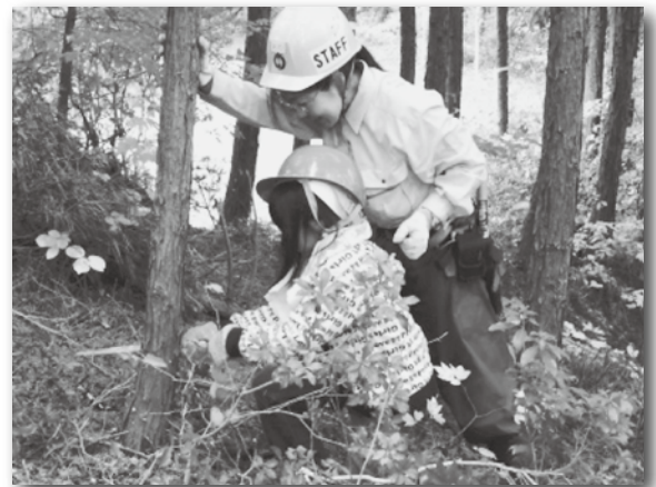
▲森と緑づくり体感ツアー(豊田市)