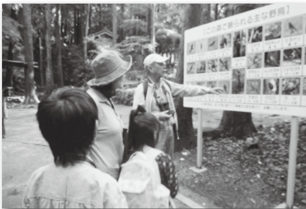
▲観察会にて看板を見ながらの説明

冬の時期に町内の池を数か所まわり、主に「カモ類」を観察しました。散策される人に見ていただくよう、中央公園・不動ヶ滝に看板を設置しました。