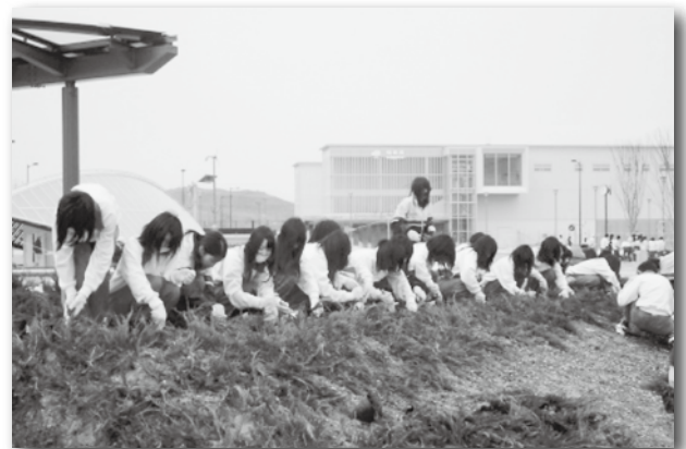
▲相見駅周辺の植栽風景

・新駅開業駅前広場植樹祭・相見8号公園植樹祭 相見駅開業に伴い、幸田高校や北部中学校の生徒と一緒に公園や駅前広場などに植栽を行いました。