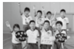
▲トヨサカ☆ドラゴン