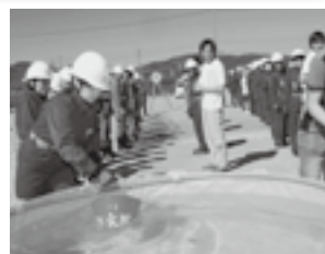
▲昨年のバケツリレー訓練の様子