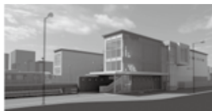
▲相見駅東側完成予想図