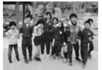
▲おにぎりおいしいよ！

う狩りへ行こうよ」が終わるころには、行きよりも何人も友達が増えました。もう1年生も坂崎っ子。みんな仲良く学校へ帰ってきました。1年生とふれ合えた、とてもよい時間となりました。