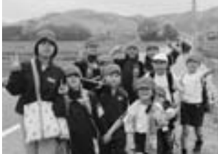
▲里山へレッツゴー！

4月22日(金)に1年生をむかえる会が行われました。例年ですと、体育館で1時間のレクリエーションを行っていたのですが、今年は、6年生の希望により、縦割り班でのウォークラリーを行うことにしました。これは、学区で毎年行われているウォークラリーがとても楽しく、「自分たちでもやってみたい」という思いと、里山の保全活動に参加して、「ぜひほかの学年の子たちにも里山を知ってほしい」という願