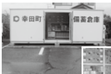
▲荻谷小学校の備蓄倉庫