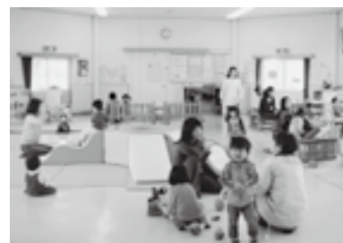
▲くりくりひろばの様子

【回答】 上六栗子育て支援センター（くりくりひろば）、菱池子育て支援センターでは、未就園児専用のスタッフを配置し、安心して遊んでいただいています。多くの方が利用されていて交流も活発に行われています。お孫さんを連れてくる人もいます。ぜひ利用してください。