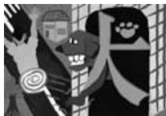
ワンッ！ 【ポスターカラー】

先生から 寄せ絵の作品です。よく見ると猫に関連するものが使われており、見る人を楽しませる作品に仕上がっています。