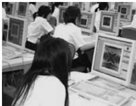
▲実習「CDジャケットの製作」（大同大学にて）

普通コースでは、平成18年度から愛知教育大学との連携講座を通して、大学進学を目指した進路指導を行っています。講座は夏と冬の2回実施され、夏の講座は3年生を対象とし、総合学習の一環として開かれています。 「異文化コミュニケーション」講座では、体験ゲームを通して自国の文化とは異なるルールやマナーがあることを疑似体験したり、「裁判員制度」講座では、一昨年開始された裁判員制度について討議しあったりしました。ほかにも心理学や社会学、数学など、人間や社会の抱える大きな問題を、分かりやすく学べる講座が開