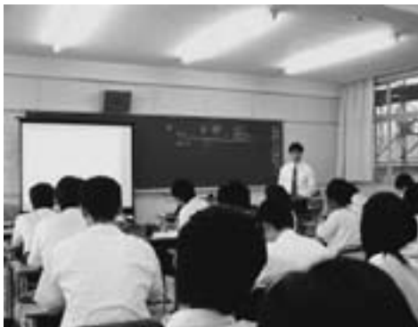
▲講義「情報の活用と表現」（幸田高校にて）

対象とし、情報の授業に位置付けられていきます。コンピュータやインターネットに関するスキルやモラルを、パソコンを利用しながら