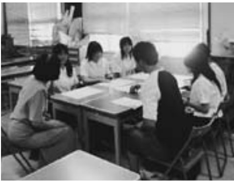
▲研究室訪問（愛知教育大学にて）

幸田高校では普通コースと情報活用コースで、それぞれ地元の大 学との連携講座を実施していま す。