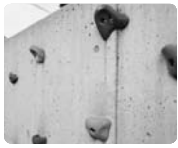
▲クライミングにチャレンジ

この公園には、なんとこの公園にはロッククライミングに挑戦できる小さなクライミングウォールがあります。