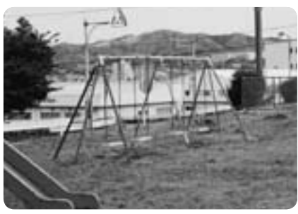
▲ブランコで遊びたくなったらちょっと南に歩くだけ！