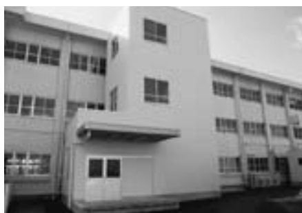
▲荻谷小学校給食エレベーター棟