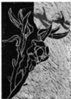
「オクラの遊園地」 【木・紙版画】