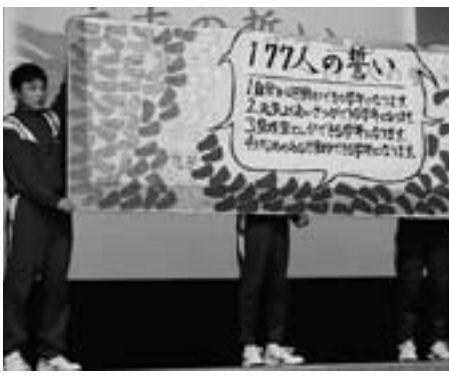
▲みんなでこんな学年にしていこう

その後の立志の式では、一人一人が、自分の将来を見つめて個人の誓いを述べた後、2学期から学年全員で話し合ってきた学年の誓いを、声高らかに唱和しました。キャンドルの炎のもとで誓った。