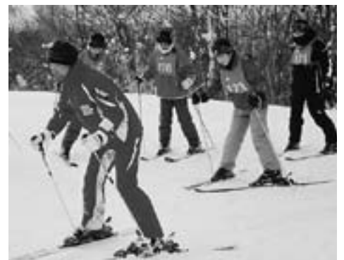
▲うまくついて行けるかな？

まだ、夜も明けきらぬ6時半に幸田中学校を出発し、乗鞍を目指します。お昼前に到着し、午後からはインストラクターの指導のもと、早速スキー実習。多くの生徒にとって初めてのスキー体験でしたが、真剣な表情と笑顔・歓声（悲鳴？）のあふれる2時間となりました。実習を終えて宿舎に戻る生徒たちからは充実感と残り2日間への期待感が感じられました。